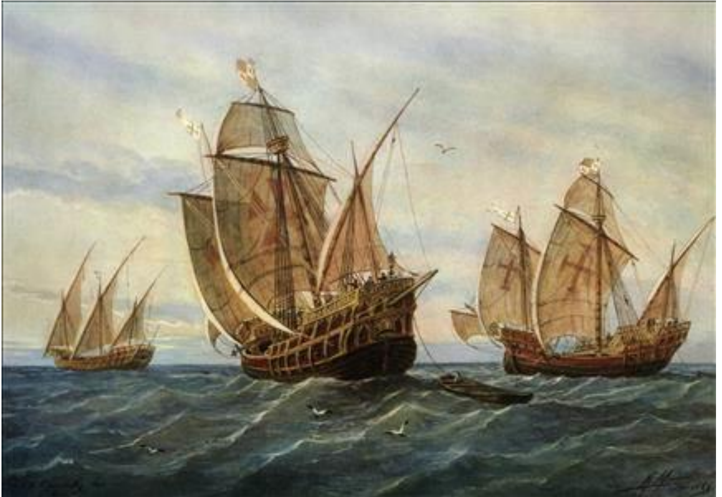
Une peinture représentant la Pinta, la Santa Maria et la Nina, les caravelles de Colomb.

Document 1 : Le premier pour rappeler la présence des trois caravelles, puis le second comme support pour l'écriture.